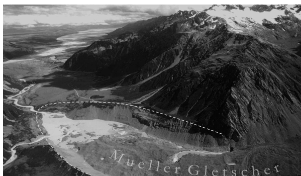
Der Mueller-Gletscher (im Vordergrund) auf der Südinsel Neuseelands schmilzt zusammen, wie die meisten Gletscher der Erde.

wie der Rest der Erde. Die Fläche des arktischen Meereises ist in den letzten Jahrzehnten um 15–20% geschrumpft, die Schneedecke hat um 10% abgenommen, die Gletscher in der Region schwinden und das Abschmelzen des Eisschildes auf Grönland hat sich überraschend stark beschleunigt.