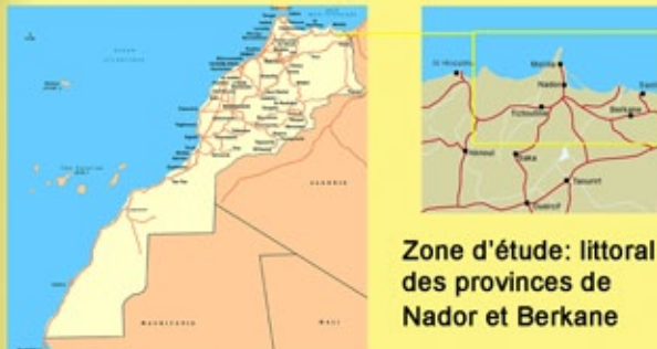
Zone d'étude: littoral des provinces de Nador et Berkane