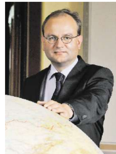
Ottmar Edenhofer: Der Ökonom fordert den Abbau von Subventionen für fossile Energieträger.

Edenhofer ist Vorsitzender der Arbeitsgruppe III des Weltklimarats (IPCC). Er zählt zu den einfluss-